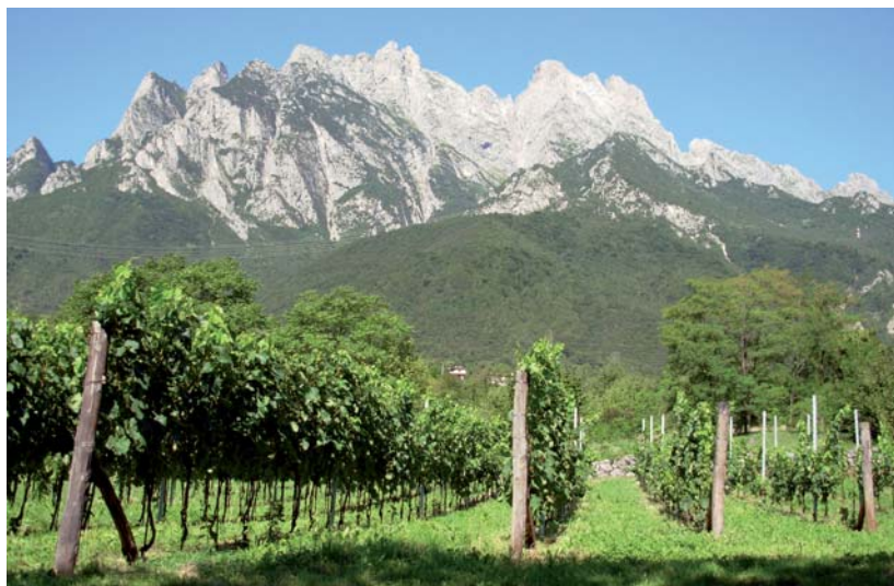
Itinerario "Tra vigne e vini".

E' stata quindi possibile la creazione di itinerari turistici a tema agroalimentare, mediante la realizzazione di aree di sosta attrezzate, l'ideazione e posa di una segnaletica illustrativa coordinata, il coinvolgimento degli operatori della ricettività e dei Sapori di Valle Camonica; seguita dalla promozione degli stessi attraverso la creazione di materiali ed eventi promozionali dedicati (seminari tecnici, cofanetto con libretto e dépliant divulgativo, sezione "percorsi" del sito www.galvallecamicavaldiscalve.it , app. GAL ITINERARY) e dalla costruzione della relativa offerta turistica necessaria alla commercializzazione finale dei percorsi.