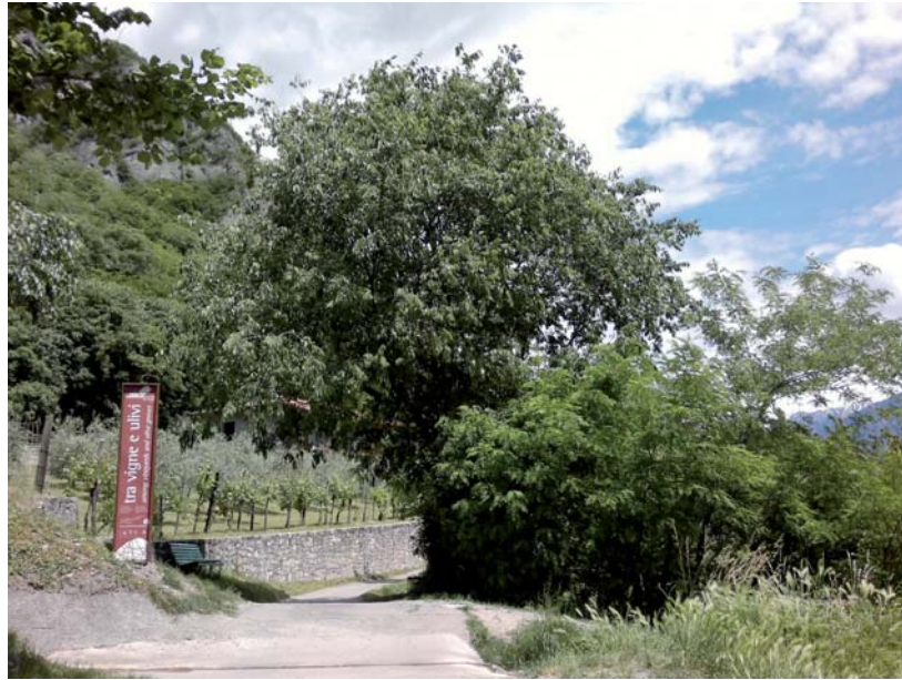
Tra vigne e ulivi.