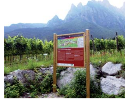
Misura 125 B. Tra vigne e vini. Tratto in Comune di Losine. Misura 313. Bachecca Consorzio Vini di Valcamonica.

Il tutto, eseguito con materiali e tecniche costruttive locali, al fine di garantire un buon inserimento ambientale delle opere.