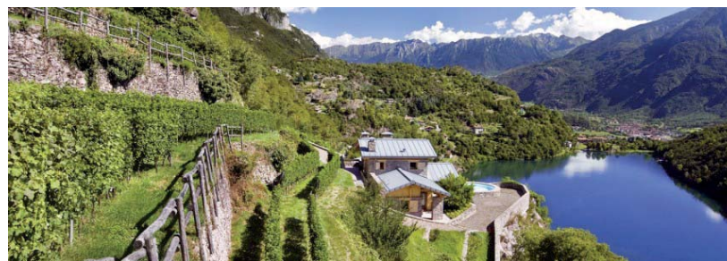
311 C. Azienda Agricola Scraleca.

Il percorso didattico presentato dall'Azienda Agricola Scraleca (Comune di Darfo, Loc. Grimaldi) si snoda tra vigneti e oliveti privati, coinvolgendo tre edifici rurali con destinazione agriturismo (Grimaldi 1 e Grimaldi 3) e degustazione prodotti (Grimaldi 2). L'intervento, oltre ai lavori di recupero dei tre edifici, ha visto l'ampliamento della proprietà grazie all'acquisizione di un vasto terreno confinante denominato "Cor-