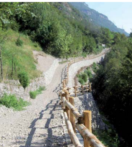
Tra vigne e ulivi.

Prende avvio nei pressi della stazione ferroviaria di Piancogno in direzione della località Annunciata, dove sorge l’omonimo Santuario e a seguire attraversa a mezza costa i piccoli centri abitati di Piambornino e Erbanno. L’itinerario prosegue tra i vigneti verso la dominante Boario Alta per poi raggiungere la frazione di Gorzone, sino al piccolo borgo di Capo di Lago. Contraddistinguono il percorso le numerose cantine, dove è possibile degustare i vini IGT di Valle Camonica, le aziende agricole produttrici di Olio (D.O.P. Olio extravergine d’oliva “Laghi Lombardi”) e le molteplici evidenze storico-culturali dell’area.