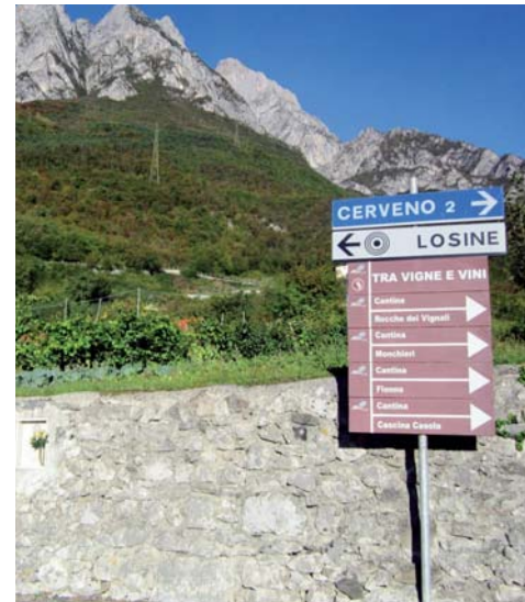
Misura 125 B e 313. Tra vigne e vini, Losine.

Lo stesso itinerario, in Comune di Losine