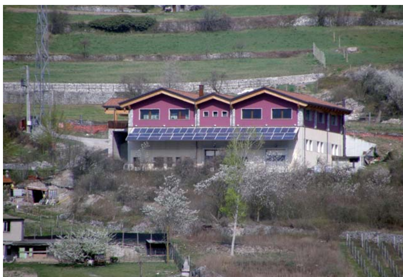
Misura 311 B. Impianto fotovoltaico della Cantina Consorziale di Valle Camonica, Losine.