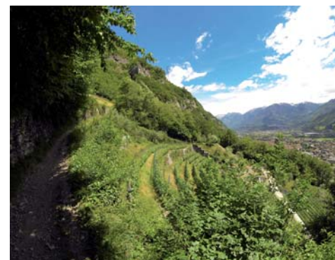
Itinerario "Tra vigne e vini".

Tale strategia si pone come obiettivo principale quello di dotare le aree a vocazione vitivinicola presenti sul territorio di appositi percorsi che colleghino tra loro le principali cantine ed i vigneti della media e della bassa Valle Camonica, recuperandone le coltivazioni ed il relativo paesaggio, dotando così gli operatori del settore di nuovi servizi connessi ad una via di comunicazione prioritaria, e creando altresì degli itinerari a valenza turistica, agroalimentare, naturalistica e didattica, in grado di valorizzare sia i vi-