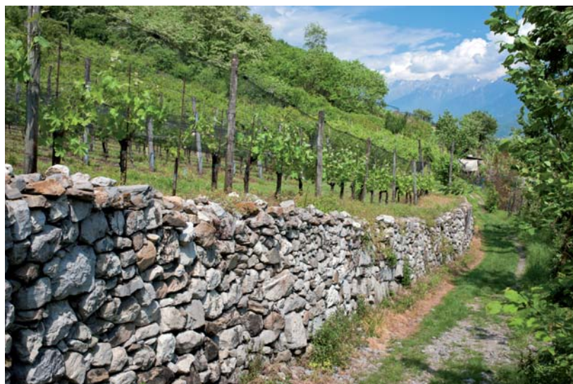
Tra vigne e ulivi.

Il prossimo passo del GAL sarà quindi la diffusione di tali materiali promozionali , per la commercializzazione dei percorsi a fini turistici, per contribuire allo sviluppo di un’economia sostenibile del territorio .