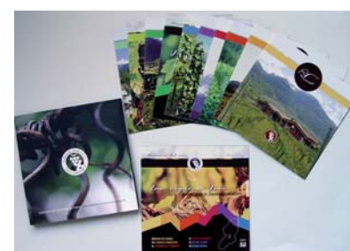
Misura 313. Cofanetto Consorzio Vini di Valcamonica.

della segnaletica stradale, in modo da facilitare il raggiungimento alle aziende consorziate. Si è poi intervenuti sul posizionamento della cartellonistica informativa a supporto dei visitatori. In una logica di continuità ed implementazione del lavoro di sviluppo del territorio promosso dal Gal Valle Camonica Val di Scalve, si è intervenuti sull'infrastrutturazione di due percorsi ciclo - pedonali ("Tra vigne e vini" e "Tra vigne e ulivi") legati al tema dell'enogastronomia e delle produzioni locali. Il progetto ha visto poi la predisposizione nelle cantine associate di aree ricreative e di servizio a disposizione dei visitatori e la realizzazione di nuovo materiale promozionale che, oltre a fornire informazioni relative alla coltivazione della vite, alle cantine e alle produzioni locali, valorizzi anche i percorsi sopra citati. Infine, si è provveduto all'acquisto di n° 800 bicchieri da degustazione adatti sia a vini bianchi che a vini rossi, con impresso il logo del Consorzio, affinché ristoranti, trattorie e agriturismi del territorio che aderiscono all'iniziativa possano utilizzarli servendo i vini I.G.T. di Valle Camonica.