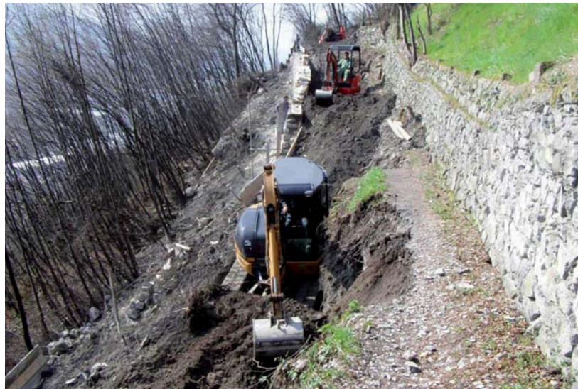
Misura 125 B. Tra vigne e ulivi. Tratto Piamborno-Erbanno.

La prima azione messa in atto nell'ambito dell'itinerario del vino, è stato il recupero e miglioramento qualitativo della rete della viabilità agro-silvo-pastorale. Questa azione, oltre a rendere più accessibili le aree a vocazione vitivinicola e a favorire la nascita di nuove aziende agricole del settore, ha permesso di valorizzare la tradizionale pratica della viticoltura anche attraverso la creazione di