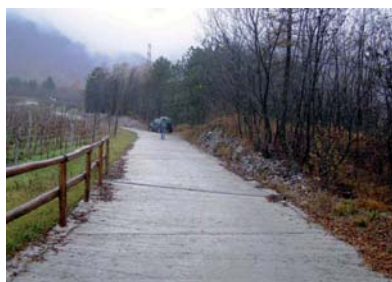
Misura 125 B. Tra vigne e vini. Tratto in Comune di Losine.

ne, ha visto invece l'intervento sulle strade agro-silvo-pastorali di Sendine - Pero e dei Termini, migliorandone la sicurezza e potenziandone la transitabilità. Tali migliorie hanno permesso inoltre il recupero di appezzamenti di terreno agrario attualmente in fase di abbandono e la nascita della cantina Monchieri, situata ai piedi della Concarena e ben inserita nel contesto paesaggistico.